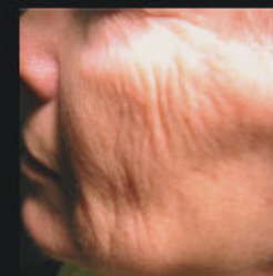
Voor de behandeling